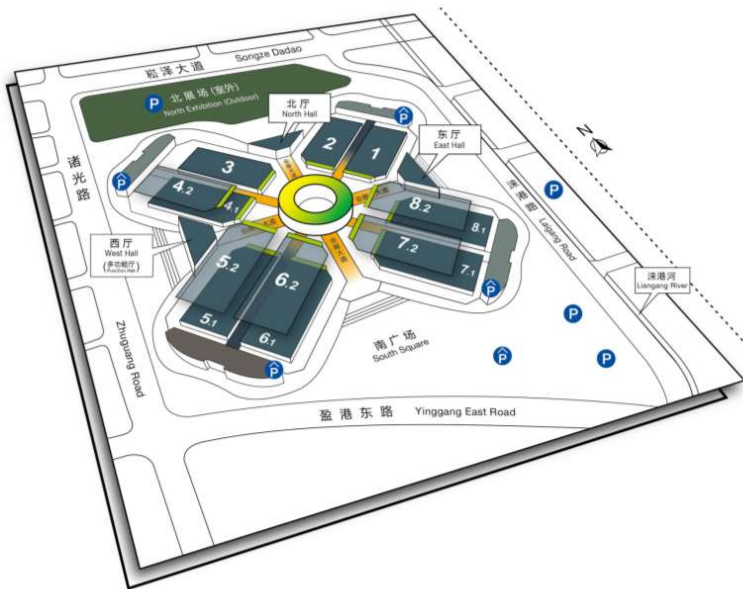
国家会展中心(上海) National Exhibition and Convention Center (Shanghai)